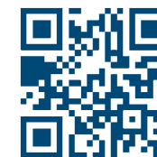
Lista wystawców targów Z