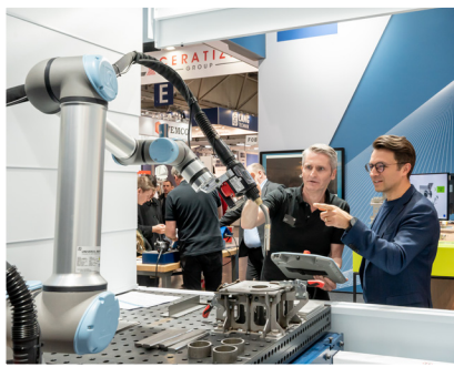
Lista wystawców targów Intec